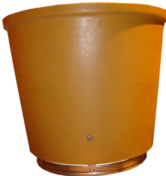
(Diffusor for CD 600).